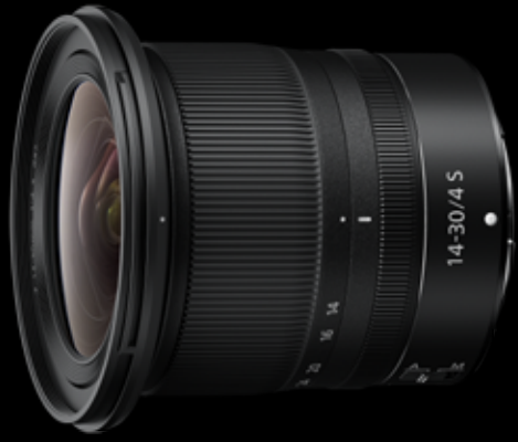
NIKKOR Z 14–30 mm 1:4 S