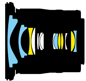
■ Asphärische Linsen ■ ED-Glas-Linsen