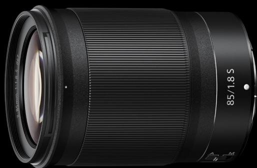
NIKKOR Z 85 mm 1:1,8 S