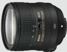
AF-S NIKKOR 24-85 mm 1:3,5-4,5G ED VR