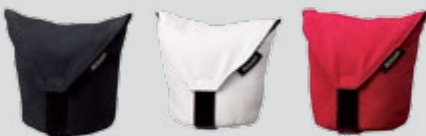
Objektivbeutel (Schwarz, Weiß, Rot) CL-N101